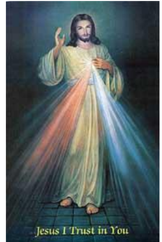
聖ファウスティナに現れたイエス